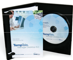
TempTale Manager® Desktop Software

Инструменты, которые преобразуют данные в информацию