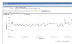
Data Management Services