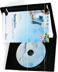
TempTale Manager® Desktop Software

Werkzeuge, die aus Daten Informationen machen.