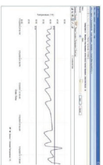
Data Management Services